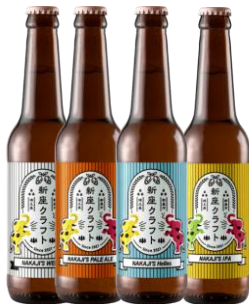
新座クラフト 各種

・ 地元酒、カジュアルギフト：バリエーション豊かに取り揃え、選ぶ楽しさと新しい食の魅力をお届けします。