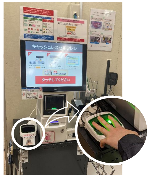
生体認証決済セルフレジ