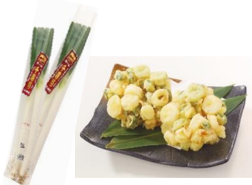
農産「千寿葱」とお惣菜の 「千寿葱のかき揚げ」