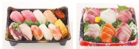
水産 北千住店限定 寿司 千住にぎり/刺身 千住盛り