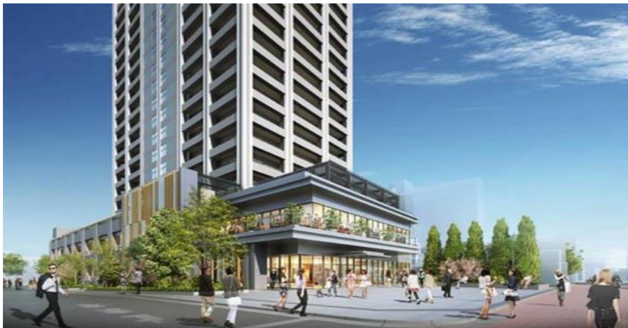
「北千住店」店舗外観イメージ

北千住店は、東武グループのスーパーマーケット事業を営む店舗として、地域社会とともに持続的に発展できるよう、従業員一同明るく親切な接客を心がけ、「地域で一番買いやすい店づくり」を目指します。