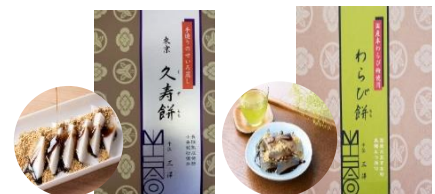
足立区足立 ミサワ食品 東京久寿餅大判/わらび餅