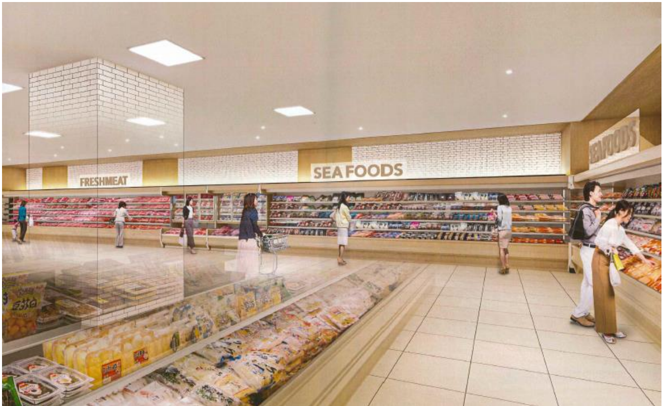
「北千住店」 精肉・鮮魚売場イメージ