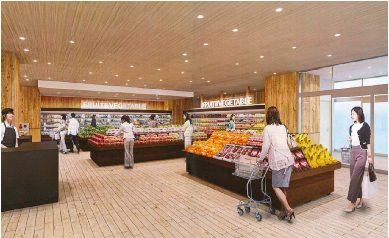
「北千住店」 野菜・果物売場イメージ