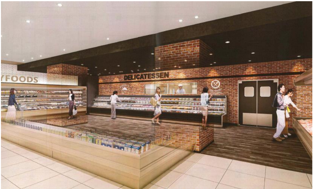
「北千住店」 惣菜売場イメージ