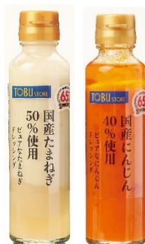
国産たまねぎ50%使用ピュアなたまねぎドレッシング 国産にんじん40%使用ピュアなにんじんドレッシング