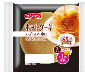
フジパン ホットケーキ メープル&マーガリン 2個+1個 50%増量