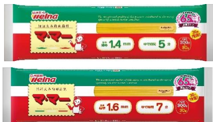
マ・マー スパゲティ1.4mm 300g+30g増量 マ・マー スパゲティ1.6mm 300g+30g増量