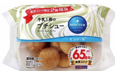
モンテール 牛乳と卵のプチシュー 10個+2個増量