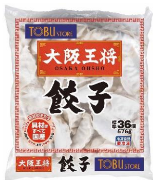
東武ストアオリジナル 餃子36個