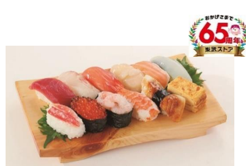
65周年記念にぎり寿司