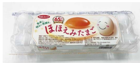
丸紅エッグほほえみたまご 10個+2個増量

2024年は年間を通して、創業65周年を記念した商品を販売する他、お客様に喜ばれる記念企画を定期的に開催します。創業65周年記念企画の内容については、当社ホームページの他、店頭ポスターやチラシ、東武ストアアプリ、公式 X(旧 Twitter)にて随時お知らせします。