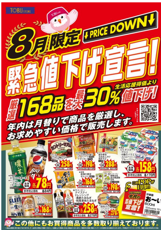
告知ポスター(イメージ)

今後も東武ストアは、「地域で一番買いやすい店」を目指し、お客様にご満足していただける商品をお値打ち価格で提供します。