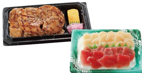
【北海道フェア限定】惣菜・刺身

※店舗により取扱商品が異なる場合がございます。※商品は数量限定のため、なくなり次第終了となる場合がございます。