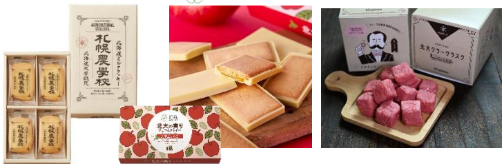
北大ブランド商品