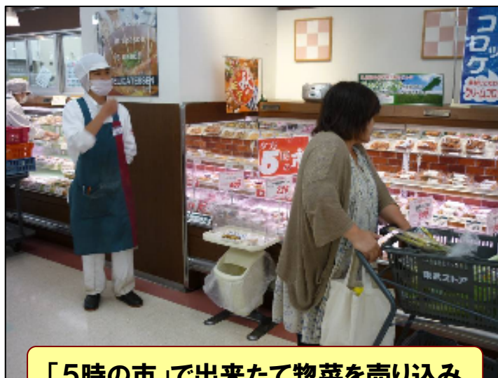
「5時の市」で出来たて惣菜を売り込み

「5時の市」、「大朝市」などで店舗内の活気を盛り上げて お客様への売り込み姿勢を従来以上に強化する