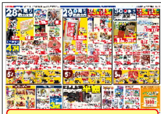
従来の「B4」サイズから