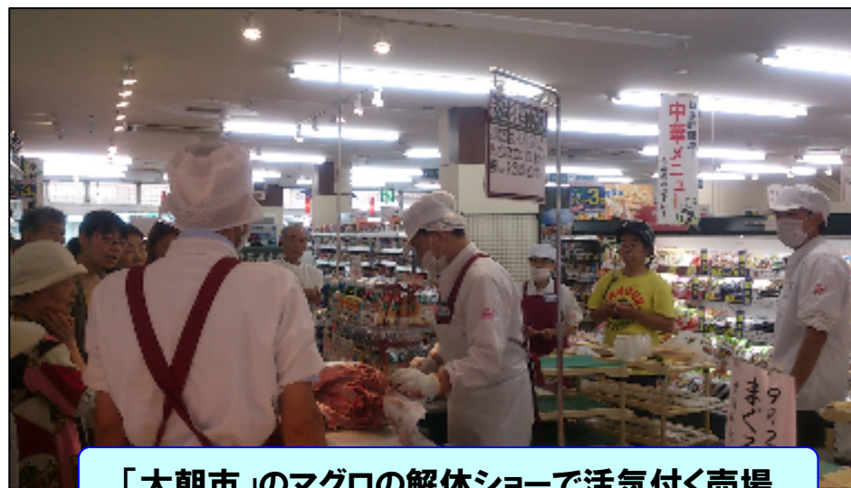
「大朝市」のマグロの解体ショーで活気付く売場