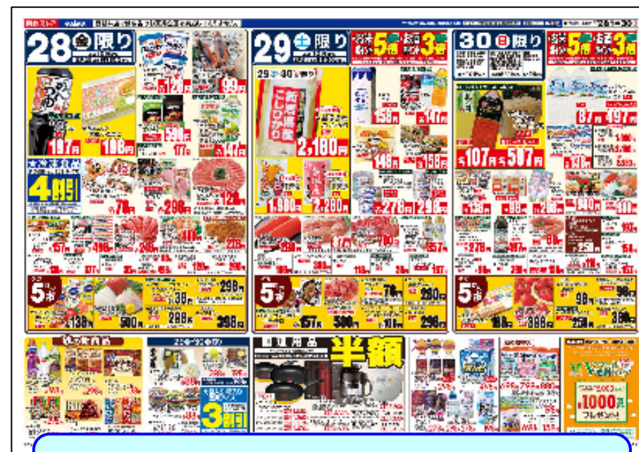
「B3」サイズへ変更し、販促強化